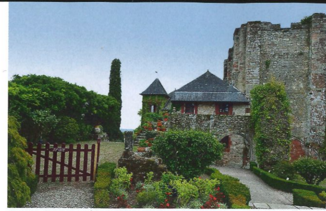
Donjon rectangulaire, jardin d'agrément... Bienvenue chez les puissants seigneurs de Turenne.

problème de courrier. Et lors des nombreux chantiers de restauration, la plupart des crépis ont été supprimés. Des travaux qui laissaient apparaître le beau grès rouge de nos demeures. La municipalité a demandé qu'on rajoute : – la-Rouge. » Collonges-La-Rouge donc, c'est 486 habitants. Mais 800 000 visiteurs dont beaucoup de camping-caristes. Alors on s'est organisés. L'aire d'accueil du Marchiadal vous est dédiée. Enfin et beaucoup d'entre vous l'admiraient, le comédien Maurice Biraud aimait Collonges où il est enterré. Il y avait restauré trois maisons. Saillac est la voisine – trois petits kilomètres seulement – de Collonges, qui lui fait de l'ombre ! Ce serait une erreur de ne pas aller la saluer. Car Saillac est le fief des noix Marbot, l'une des quatre variétés de l'AOP Noix du Périgord. À Saillac, une voix vous accueille : « Saillac, berceau de la Marbot. Quel lieu plus approprié pour