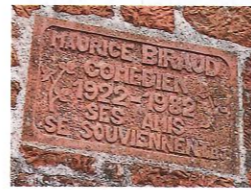
L'acteur Maurice Biraud l'avait bien compris, qui acheta et restaura trois maisons dans le village.