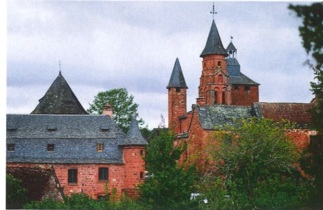
Au panthéon des Plus Beaux Villages de France, Collonges-la-Rouge, c'est LA star !