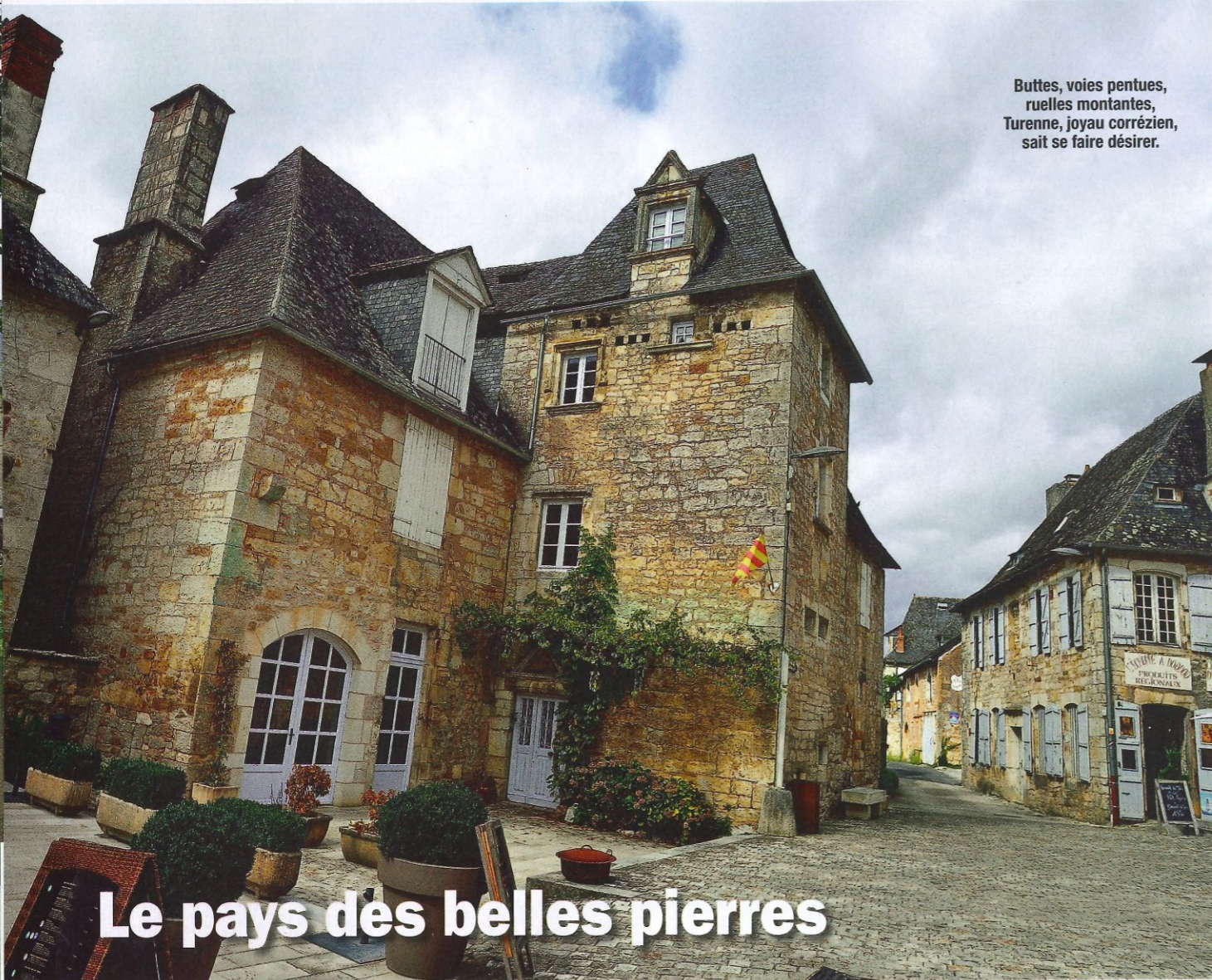
Buttes, voies pentues, ruelles montantes, Turenne, joyau corrézien, sait se faire désirer.